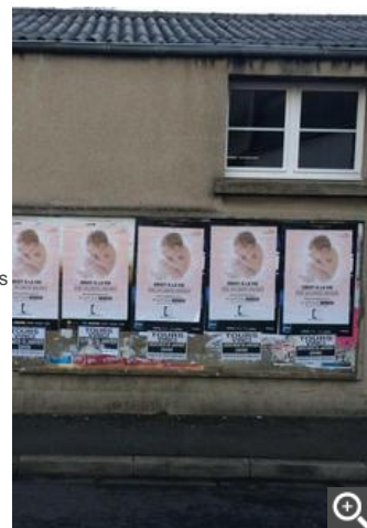
Les affiches collées fin janvier. - (Photo Osez le féminisme 37)